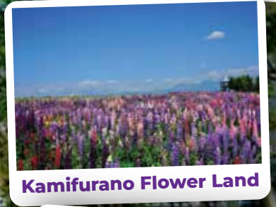
Kamifurano Flower Land