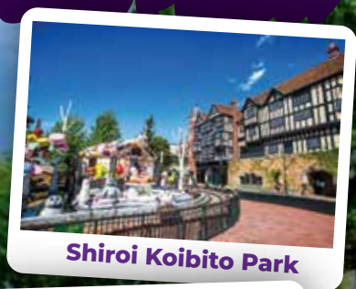
Shiroi Koibito Park